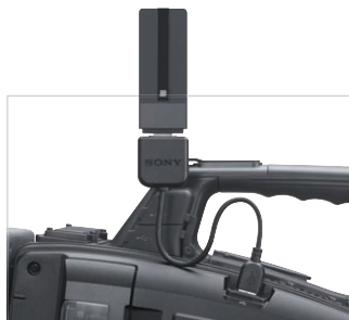
ワイヤレスLANアダプターCBK-WA02の装着イメージ

です。さらに、4K収録中でも、ライブストリーミングによる生中継ワークフローをサポートしています。これらの機能は、今後の4K制作の効率化には欠かせない重要な機能の一つです。