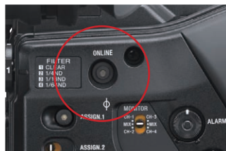
オンラインボタン